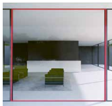
Dichtung aktiv – 100 % dicht